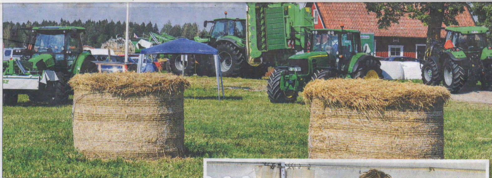
Många maskiner och traktorer visades på Vall 2014