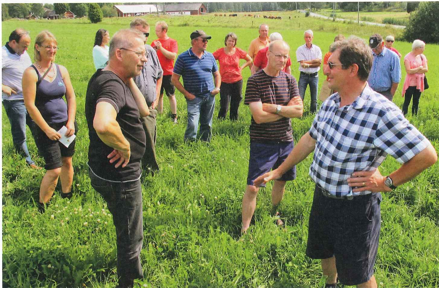
På Norrby Ängar är en effektiv vallproduktion basen för den ekologiska nöt- och lammproduktionen.