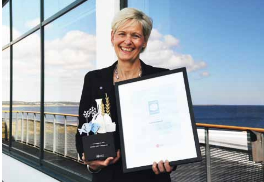
Juryn imponerades av att Svenskt kött med små resurser på kort tid lyckats få konsumenterna medvetna om svenska bönders omsorg om djur och miljö.