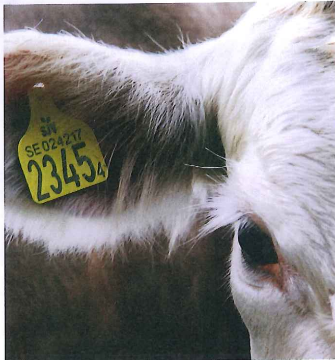
Från 1 januari riskerar man att få tvärvillkorsavdrag om man rapporterar in för sent till CDB.

En sen rapportering, som har bedömts som en mindre överträdelse, ligger kvar i registret under tre år. Det betyder att man vid en ny miss riskerar retroaktivt avdrag på tvärvillkoren, samt ett förhöjt avdrag för upprepning.